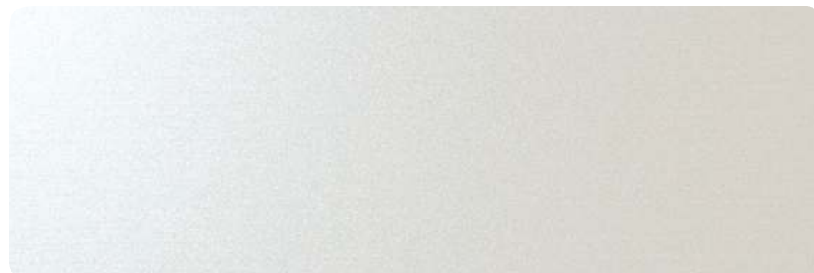
Silver Nacre / BP 1600